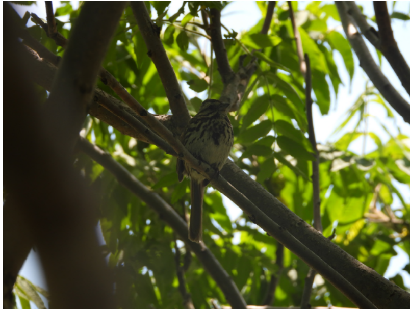
Photographie 1: Bruant chanteur à proximité de son nid.