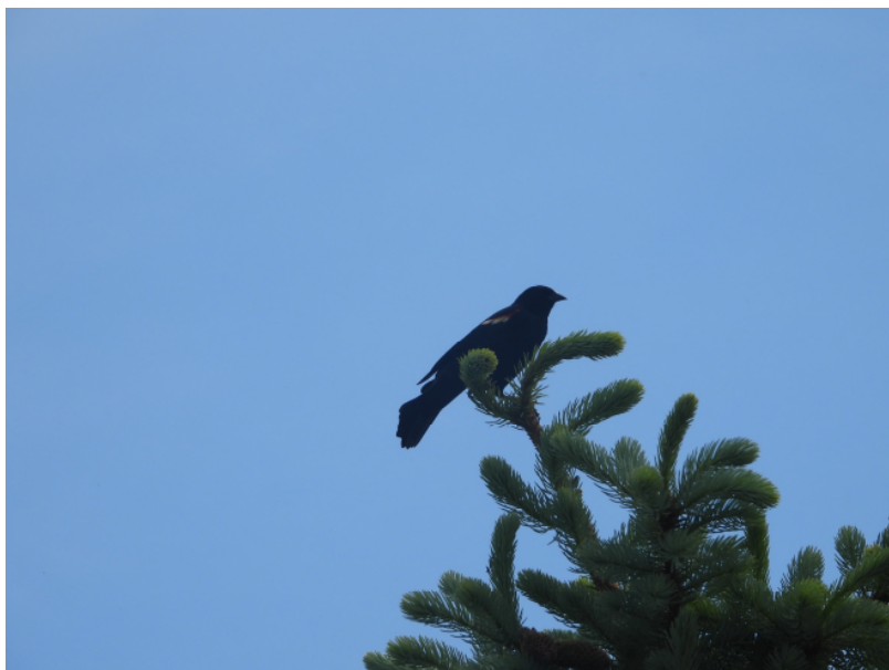
Photographie 2: Carouge sur épinette avec comportement montrant la présence d'un nid dans l'arbre.