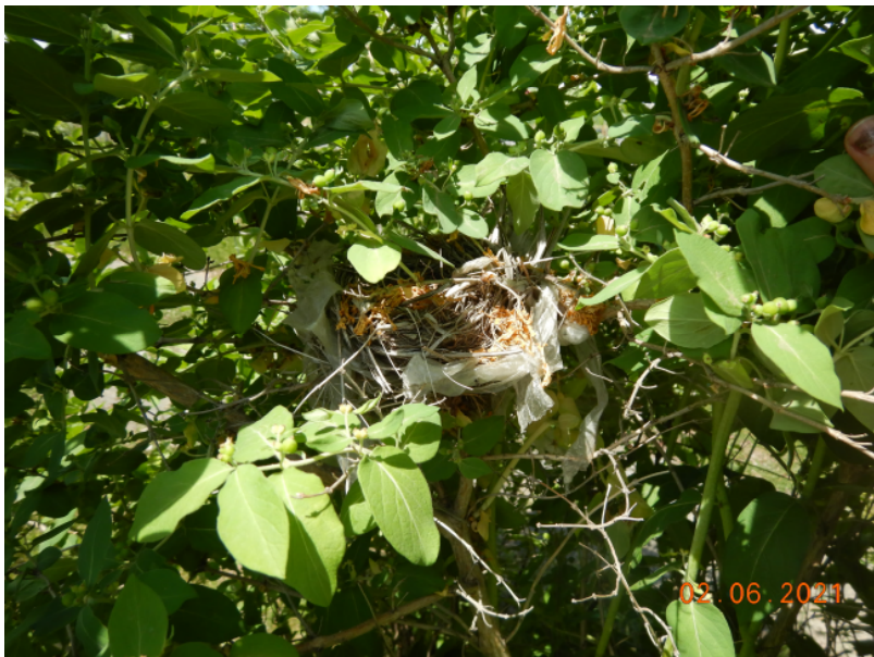
Photographie 4: Nid non actif dans un chèvrefeuille.