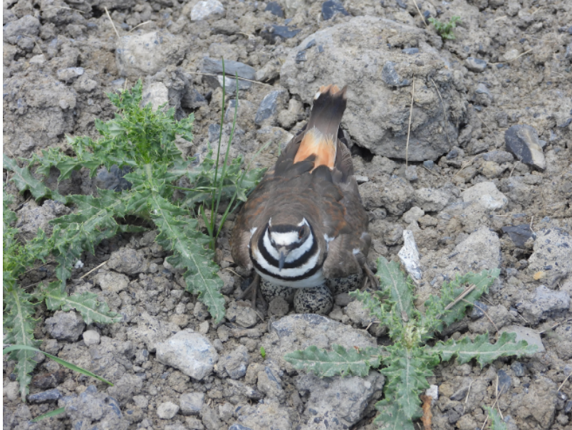
Photographie 3: Nid du pluvier kildir.